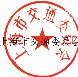
上海市交通委员会