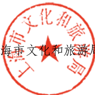
上海市文化和旅游局