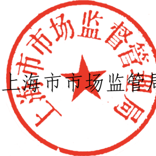
上海市市场监管局